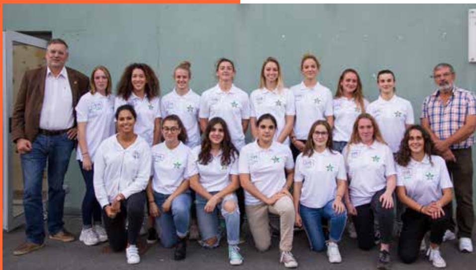
Équipe Élite USB 2020