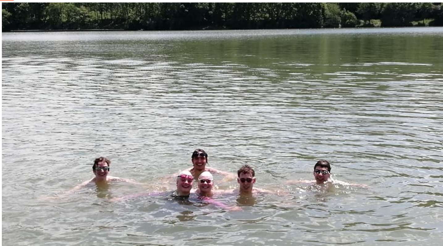
Groupe des Nageurs Brunosiens aux Championnats de France Eau Libre à Brive.