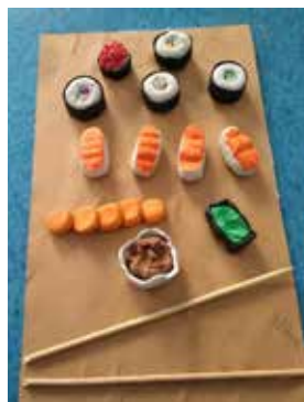
Des sushis en arts plastiques