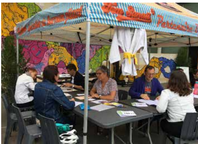
"Notre stand lors de la Journée Portes Ouvertes"

A l'Union Saint-Bruno, la section propose depuis de très nombreuses années des créneaux horaires spécifiques à cette population des 4/5 ans. Pour cette saison 2019/2020, les enfants nés en 2014 et 2015 peuvent pratiquer au Dojo de la rue Brizard :